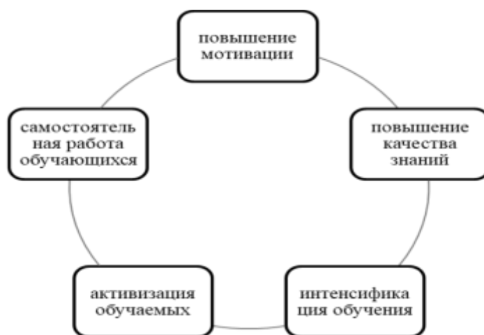
Рис. 1. Задачи, решаемые в ходе применения видеоматериалов на уроках английского языка

Для второго подхода характерно преувеличение возможностей видео и выделение его на этом основании в качестве самостоятельного средства обучения. Применение видеозаписей на уроках содействует индивидуализации преподавания и формированию мотивированности вербальной деятельности обучаемых. Особенность видеоматериалов как ресурса преподавания обеспечивает общение с реальными предметами, стимулирующими подлинную коммуникацию: обучающиеся становятся соучастниками абсолютно всех обыгрываемых с их поддержкой обстановок, представляют конкретные ситуации, разрешают «истинные», актуальные трудности. Формируемый при этом эффект участия в повседневной жизни государства изучаемого языка не только способствует обучению естественному, живому языку, но и служит сильным катализатором с целью увеличения мотивации обучающихся (см. рис. 1).